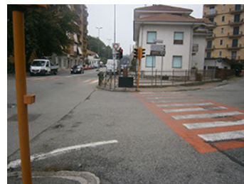
Comune di Banchette - Via Castellamonte - Rilievo fotografico dello stato di fatto