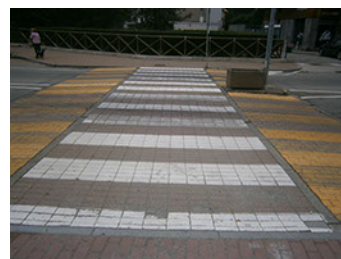
Comune di Banchette - Via Castellamonte - Rilievo fotografico dello stato di fatto