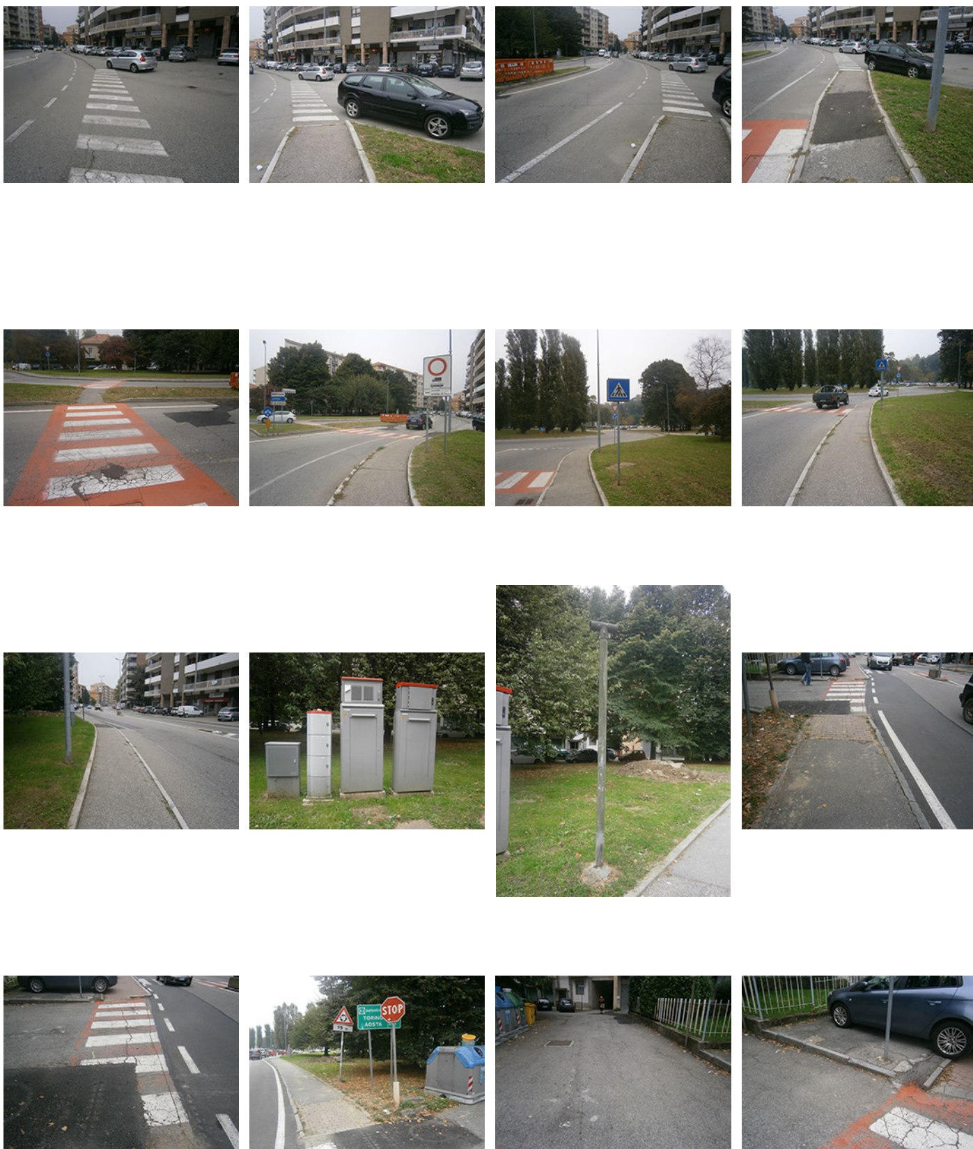
Comune di Banchette - Via Castellamonte - Rilievo fotografico dello stato di fatto