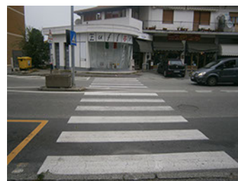
Comune di Banchette - Via Castellamonte - Rilievo fotografico dello stato di fatto