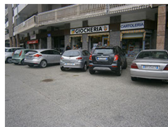
Comune di Banchette - Via Castellamonte - Rilievo fotografico dello stato di fatto