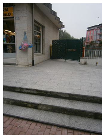
Comune di Banchette - Via Castellamonte - Rilievo fotografico dello stato di fatto