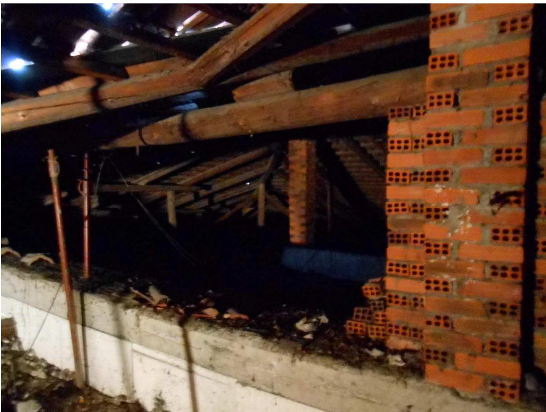
sottotetto lato nord-est