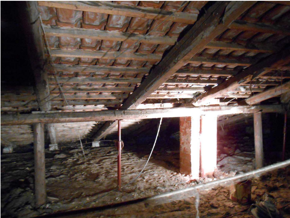
sottotetto lato ovest