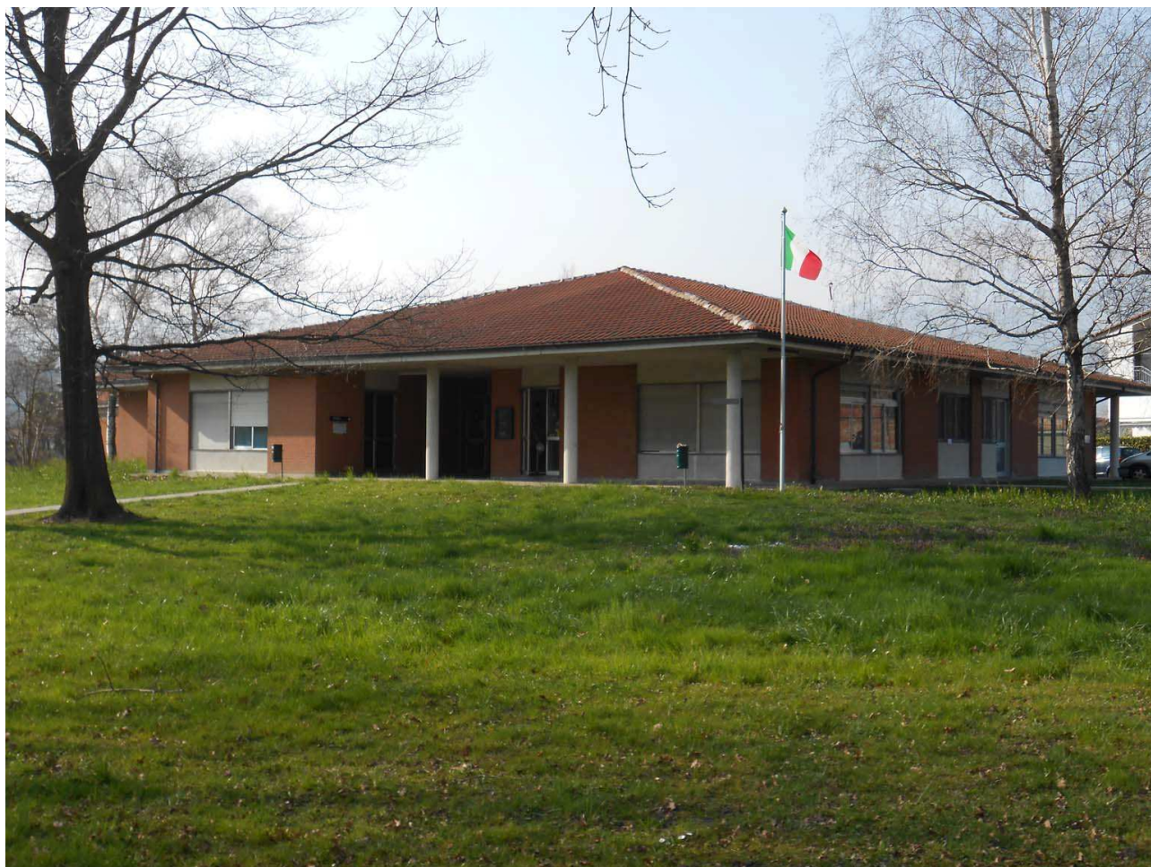
Edificio di proprietà del Comune di Banchette e utilizzato dall'ASL TO 4