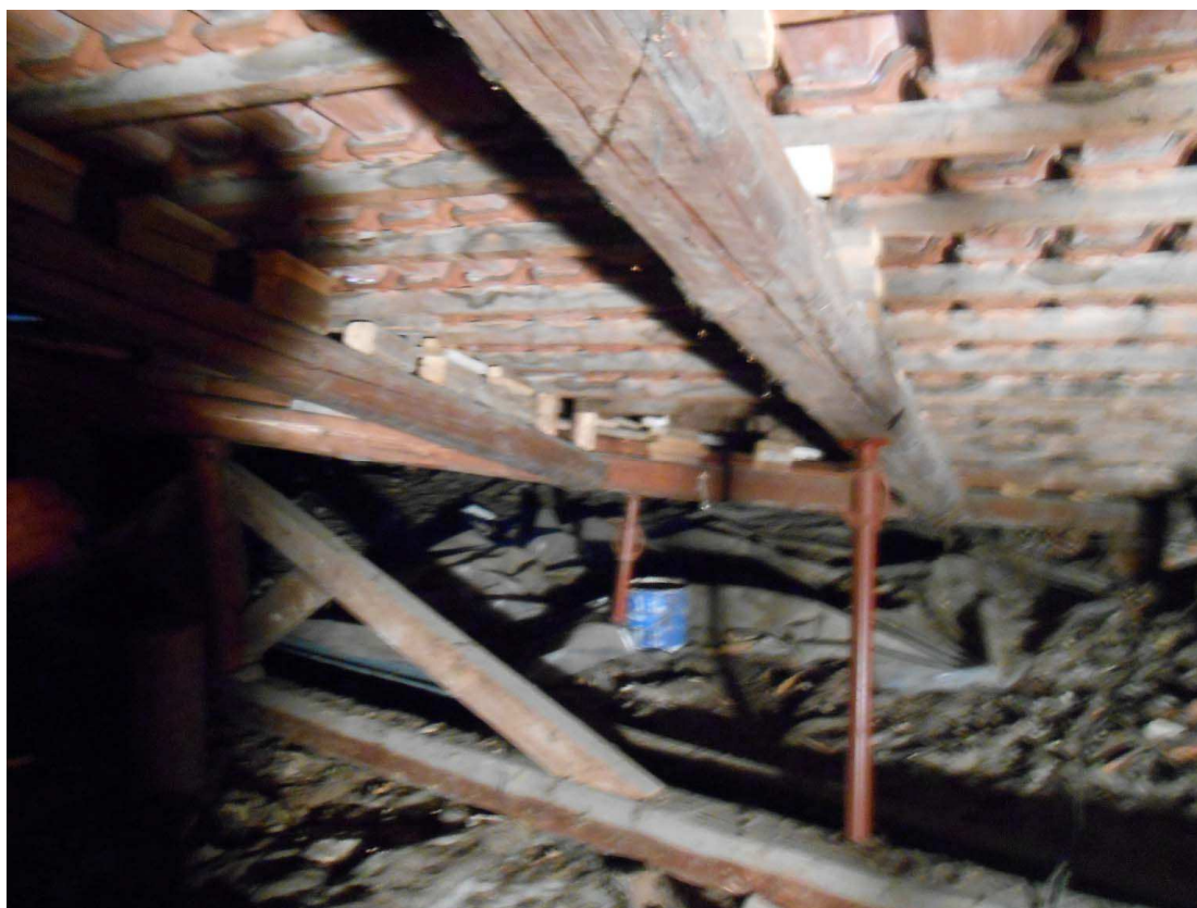
sottotetto lato sud-est