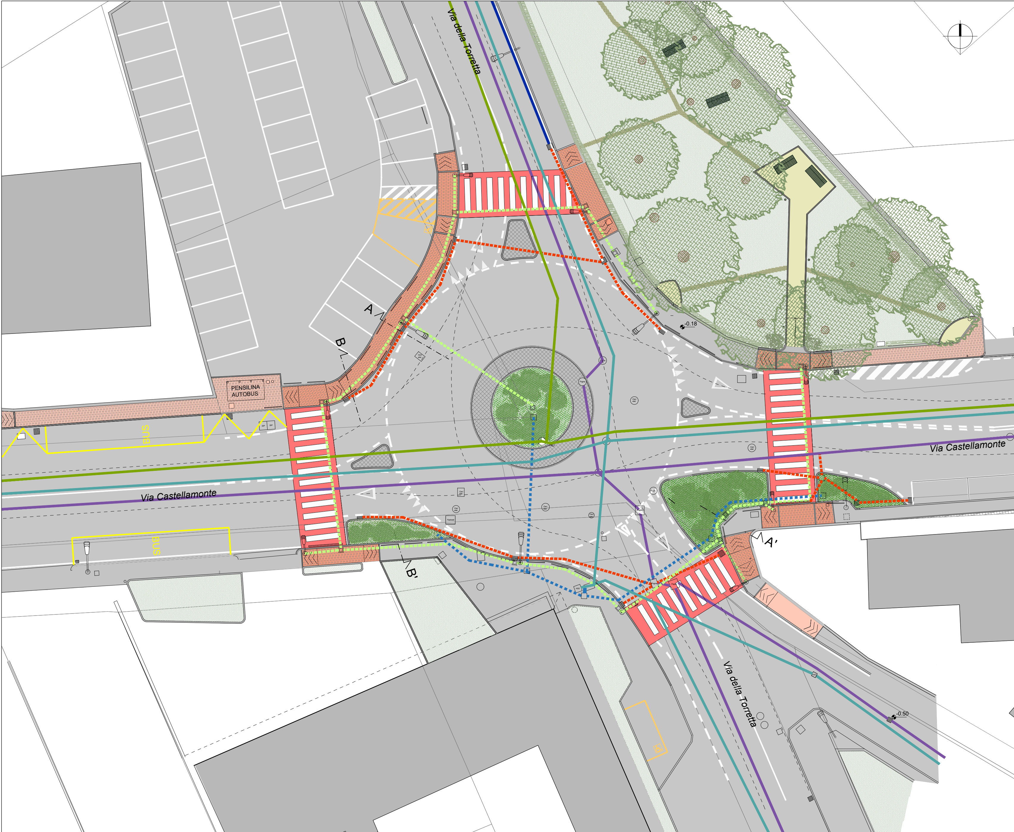
PLANIMETRIA GENERALE DI PROGETTO Scala 1:200